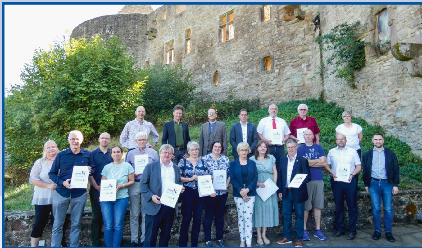
Abb. 1: Beim ersten KuLaDig-Netzwerktreffen in Rheinland-Pfalz auf Burg Lichtenberg im Landkreis Kusel hat das Innenministerium die ersten Jahrgänge der Modellkommunen ausgezeichnet. KuLaDig ist mehr als nur eine digitale Plattform, es ist Austausch, Zusammenarbeit und Gemeinschaft.