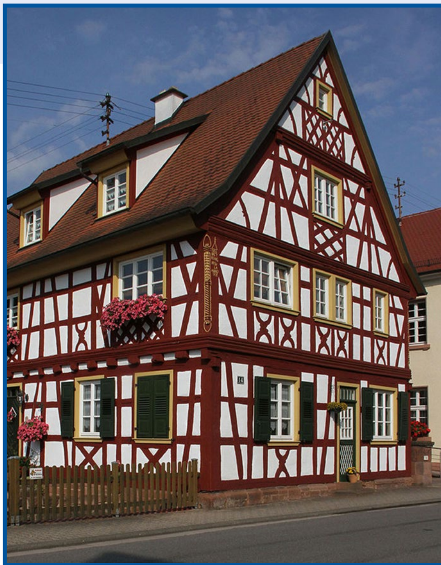
Abb. 4: Fachwerkhause Hauptstraße 14 in Bobenthal.