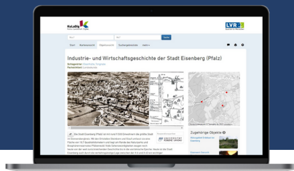
Webseite: LVR-Informationssystem KuLaDig

Tour zur Industrie- und Wirtschaftsgeschichte der Region Eisenberg (Pfalz)