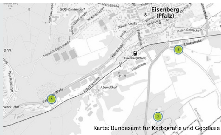
Karte: Bundesamt für Kartografie und Geodäsie